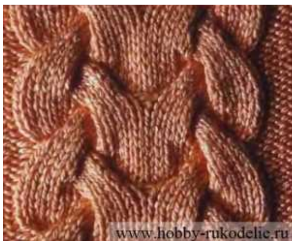
СХЕМА № 2

2-й ряд: и все изнаночные по рисунку, только первые и последние 2 петли после кромочной и до нее вязать лицевыми (чулочная гладь) как в изнаночных рядах, так и в лицевых рядах.